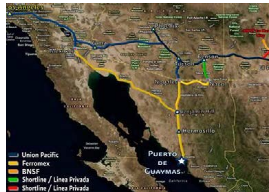
Gráfico 2. La ruta 15

La zona sur de Sonora, en la que se encuentran Cajeme, Empalme y Guaymas, ha cobrado particular relevancia en ese contexto, pues es un puerto de entrada estratégico para los precursores químicos para elaborar fentanilo y metanfetaminas que provienen de China (Poy y Martínez, 2021). El puerto de Guaymas, ubicado en el Golfo de California, permite descargar la mercancía proveniente de China directamente en una entidad fronteriza, teniendo sólo que transportarla hacia el norte por la ruta 15 con dirección a Nogales u otras fronteras del noroeste (Domínguez, 2020). Es importante mencionar que Guaymas es el puerto mexicano más cercano a la frontera con Estados Unidos en la costa del Pacífico. Además, conecta con el cruce fronterizo de Nogales mediante una autopista de cuatro carriles que abarca casi los 417 kilómetros de distancia que separan al puerto de dicha ciudad fronteriza, como puede observarse en el gráfico 2.